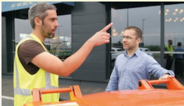
La collecte auprès des professionnels

Après ce PLP achevé dans la sérénité, place désormais pour trois ans au Contrat d'objectifs déchets et économie circulaire (Codec), un dispositif porté par l'Ademe et déployé dans le cadre du « Territoire zéro déchet- zéro gaspi », dont le SIOM est lauréat depuis 2014.