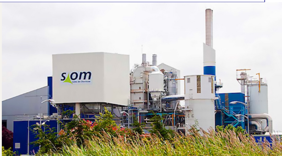
L'unité de valorisation énergétique des déchets ménagers résiduels de Villejust

Créé en 1959, le SIOM de la Vallée de Chevreuse (Syndicat Intercommunal des Ordures Ménagères) fête ses 60 ans. Son territoire compte 205 000 habitants sur 21 communes dont 19 en Essonne et 2 dans les Yvelines. Il est composé de communes pavillonnaires et de communes urbaines denses avec près de 51% d'habitats collectifs. Une gestion rigoureuse, des innovations permanentes et une recherche de partenaires et de clients efficaces lui ont permis de réduire la taxe d'enlèvement des ordures ménagères de 21 % en 10 ans.