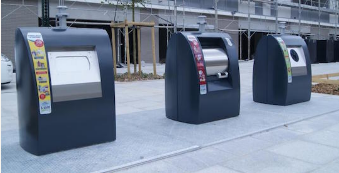
Nouveaux conteneurs enterrés, photo Ludovic Morand, SIOM

Extension des consignes de tri, installation de composteurs supplémentaires ou encore mise en place de bornes textiles : en multipliant les actions de sensibilisation, la capacité et la précision des collectes, le SIOM a permis à quantité de matières utiles de réintégrer des circuits de valorisation, tant matière, qu'organique ou énergétique dans son unité de cogénération à Villejust.