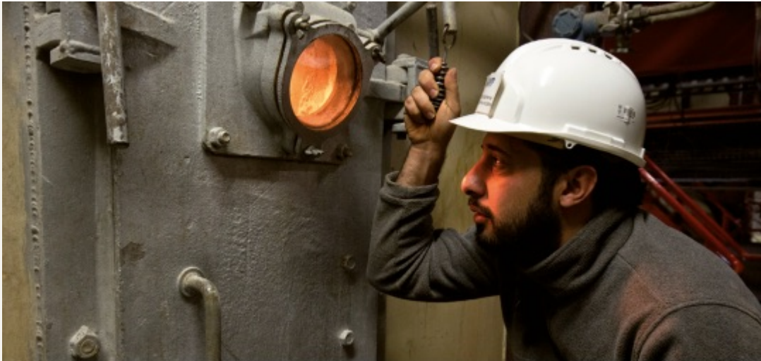
L'un des fours de l'UVE de Villejust

L'UVE du SIOM, implantée à Villejust (91) et exploitée par la société Generis, affiche une performance énergétique supérieure à 93 % et se place en tête des 63 sites exploités par Veolia dans le monde. Cette UVE a été la première unité de service public à recevoir, en 2013, la certification ISO 50 001.