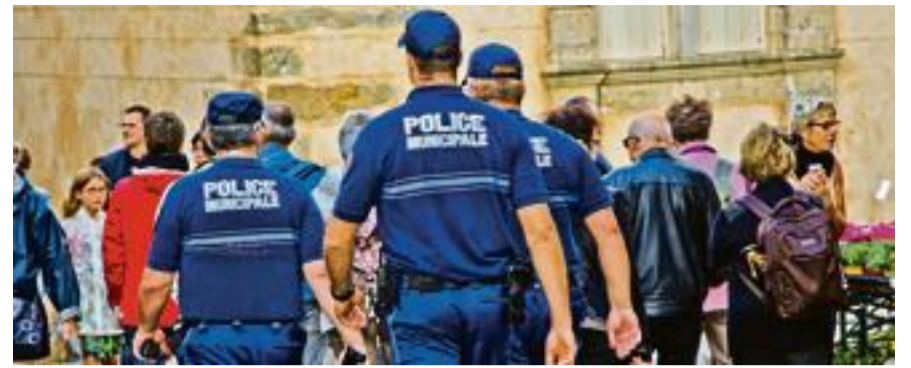
La préfecture de l'Essonne a décidé d'interdire à la commune de détenir des armes pour sa police municipale.

Le territoire du Siom est composé à la fois de communes semi-rurales, principalement pavillonnaires, et de communes urbaines denses (Palaiseau, Longjumeau), avec près de 51 % d'habitats collectifs.