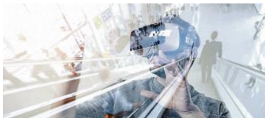
L'événement réunit, ce mercredi, des acteurs de l'innovation, de la recherche, de la science et du développement économique de la région.

Le tout nouvel institut médico-pédagogique de Draveil disposera bientôt d'un terrain de sport de 1.130 m 2 . Originalité le sol sera entièrement construit avec des balles de tennis usagées. L'établissement accueillera des enfants atteints de polyhandicap lourd, d'autisme ou de TED (troubles envahissants du développement). La réalisation du terrain sportif, le plus grand construit en France avec cette technique, aura nécessité 600.000 balles usagées. Les balles sont recueillies par les ligues régionales de tennis avant d'être recyclées, dans le cadre des « opérations balles jaunes ». — A. P.