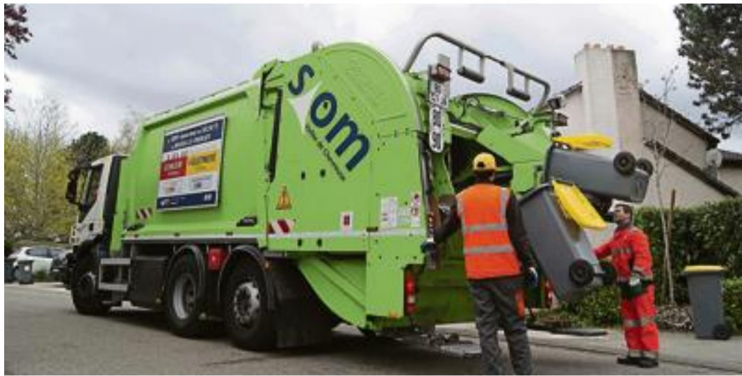
ÉCONOMIE CIRCULAIRE. En 2016, le Siom a mis au point un dispositif permettant la collecte, au sein du même bac jaune, de tous les emballages plastique, afin de faciliter le tri.